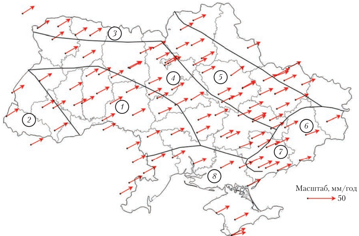
Рис. 1. Планова компонента векторів зміщень ГНСС-станцій на схемі географічного районування території України: 1 – Волинсько-Подільська височина; 2 – Карпати; 3 – Поліська низовина; 4 – Придніпровська височина; 5 – Придніпровська низовина; 6 – Донецький кряж; 7 – Приазовська височина; 8 – Причорноморська низовина)

параметрів розтягування—стиснення та обертання за годинниковою стрілкою чи проти годинникової стрілки з лінійними платформними геоструктурами України й амплітудами ПЧВР земної кори.